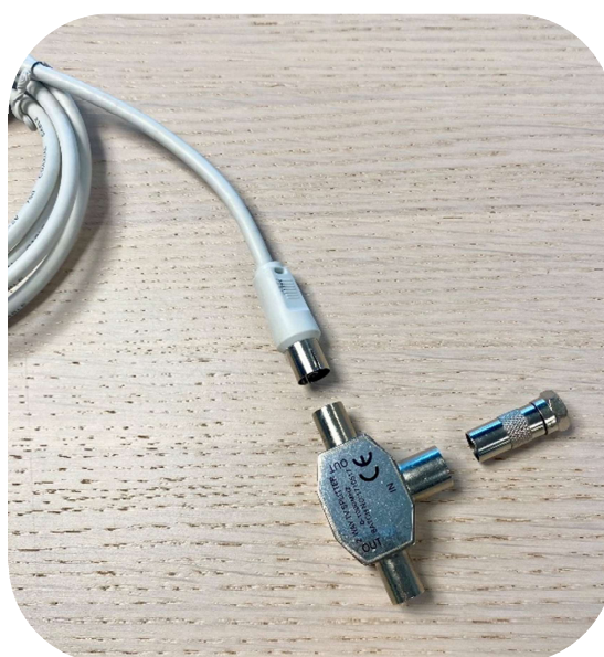
Antennkabel, antensplitt och F-kontakt