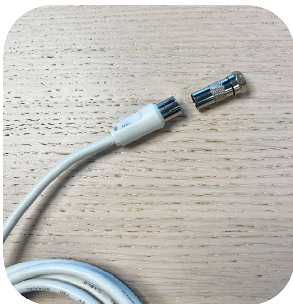
Antennkabel och F-kontakt